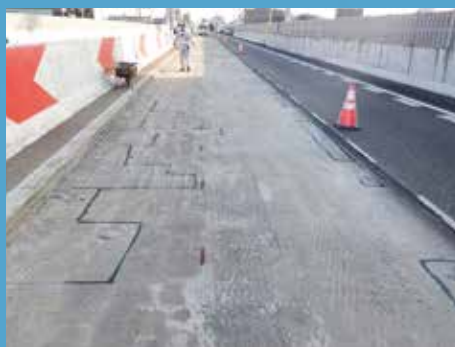
② 研り箇所マーキング