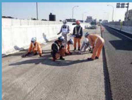
① 既設舗装撤去・事前調査