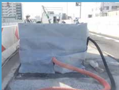
⑤ コンクリート床版劣化部撤去工