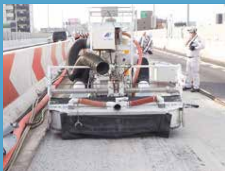
④ オートチッパー MOB-200 据付