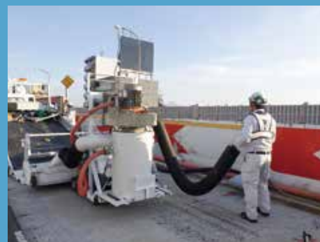
③ オートチッパー MOB-200 搬入